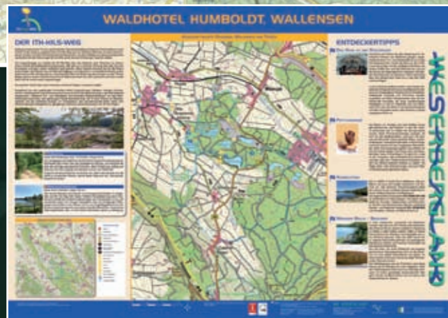
Infotafel am Wanderparkplatz des Waldhotel Humboldt